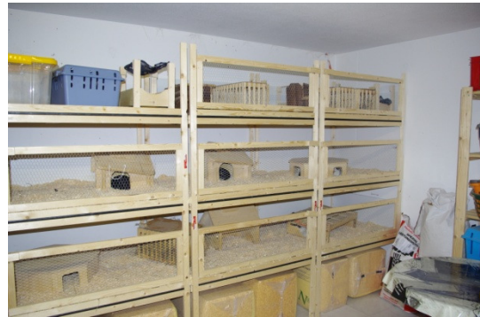
Zuchtgruppen Mädels mit Kastrat