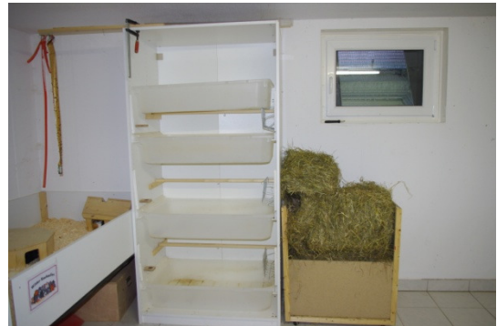
Verpaarungen und Krankenstation