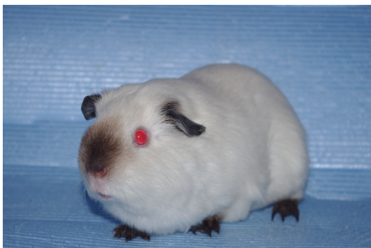
Zwei meiner Ruß Nasen :o))